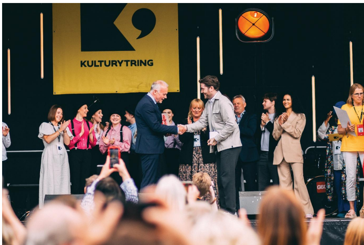
Kristiansund kommune mottok den gjeve tittelen Norges kulturkommune 2025-2027 av juryleder Grunde Almeland (V), leder av familie- og kulturkomiteen på Stortinget.