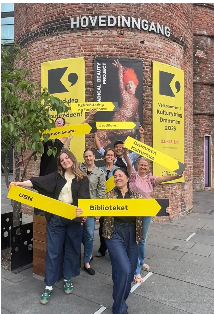
NOKU og Kulturytring stab

Fylkeslagenes aktivitet regionalt er helt vesentlige for å nå vår målsetting om at den enkelte kulturarbeider og kulturpolitiker skal ha tilgang på inspirasjon, faglig påfyll, verktøy, kolleganettverk og møteplasser.