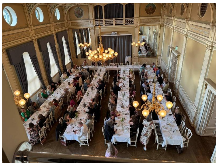
Landsmøtemiddag på ærverdige Børsen restaurant i Drammen i regi av Buskerud Fylkeskommune