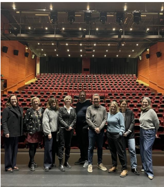
Styremøte på Jessheim i november