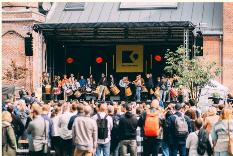
På Norges største kulturpolitiske møteplass, Kulturetring i Drammen i juni, samlet 230 kulturorganisasjoner seg og presenterte 300 programposter om kulturpolitikk og kunstens kraft i samfunnet.

Om to uker er det stortingsvalg i Norge. Det er knyttet stor spenning til hvordan sammensetningen av de 169 stortingsrepresentantene som er på valg vil se ut etter valgdagen. I valgkampens siste uker kappes partiene om å løfte viktige politiske saker og sette dagsorden i media både lokalt, regionalt og nasjonalt. Dessverre er det som vanlig ett politikkområde som stort sett glimrer med sitt fravær i de mange valgløftene som presenteres på radio, tv og på stand; nemlig kulturpolitikken.