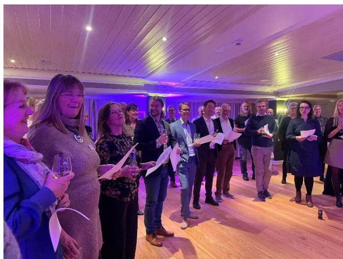
NOKU Innlandet arrangerte Pubkor for medlemmene på Innlandet kulturkonferanse på Hamar