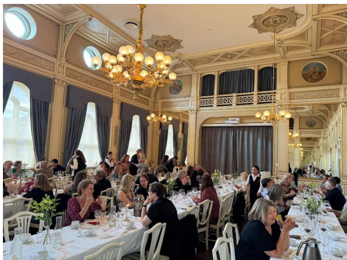
Landsmøtemiddag på ærverdige Børsen restaurant i Drammen i regi av Buskerud Fylkeskommune