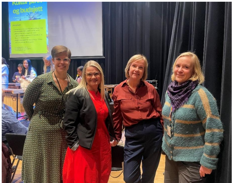
Generalsekretær på folkemøte om kulturkutt på Lørenskog