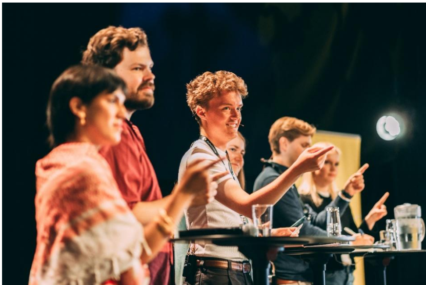
Ungdomspolitikerdebatten under Kulturytring 2025.