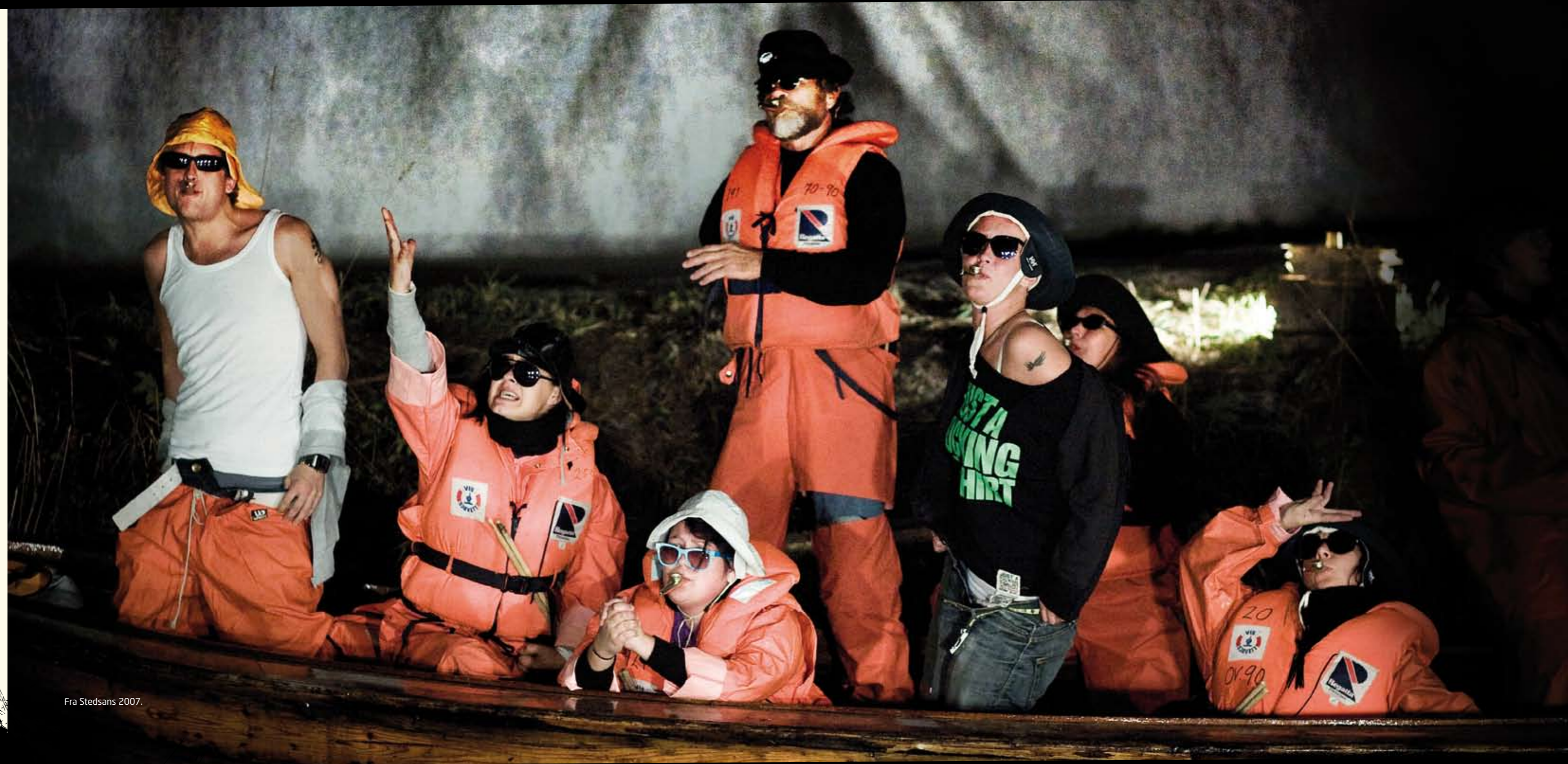
Fra Stedsans 2007.

Frå 1 aug 2007, etter res. 29 juni 2007 nr. 905.