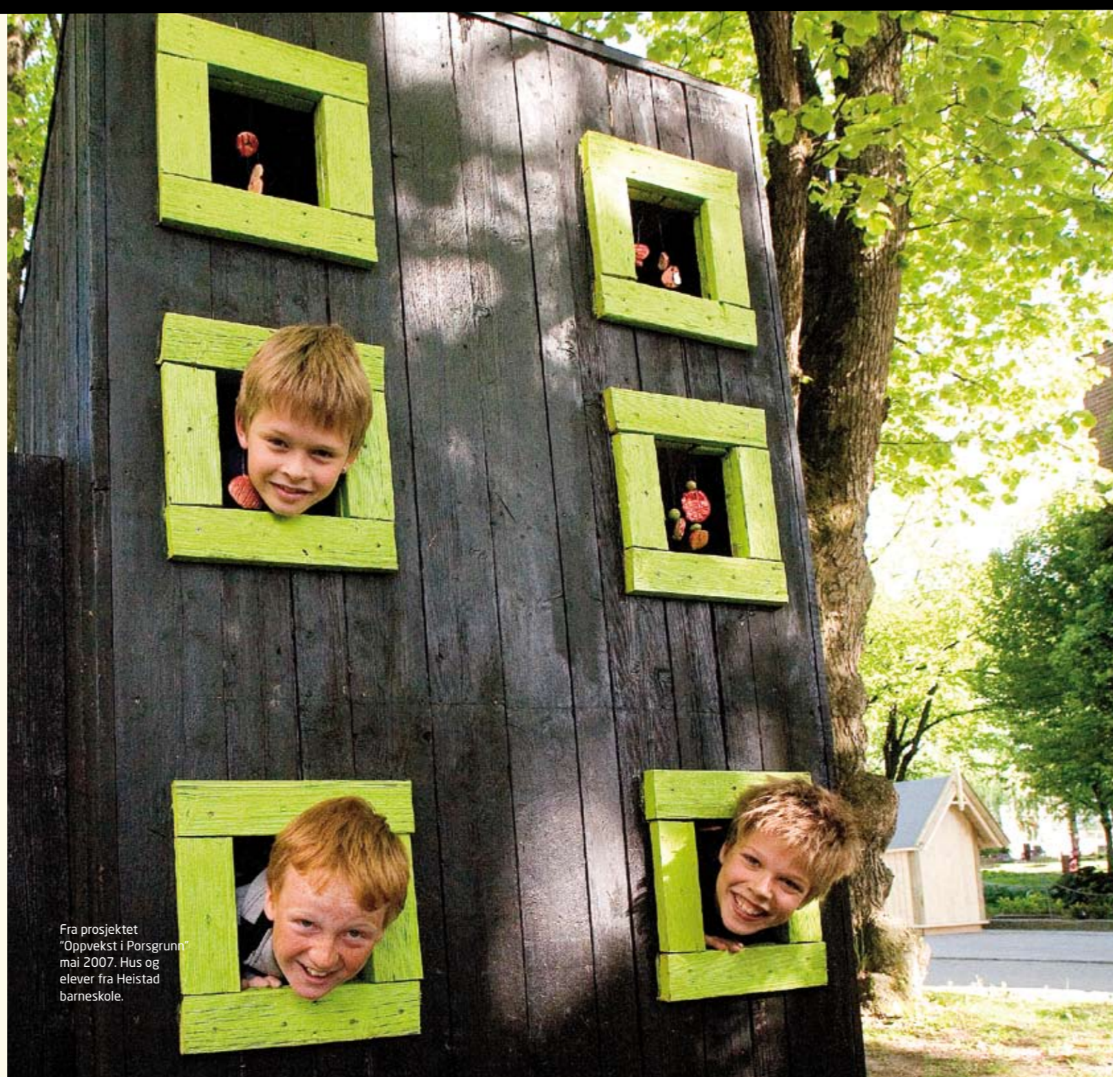
Fra prosjektet "Oppvekst i Porsgrunn" mai 2007. Hus og elever fra Heistad barneskole.