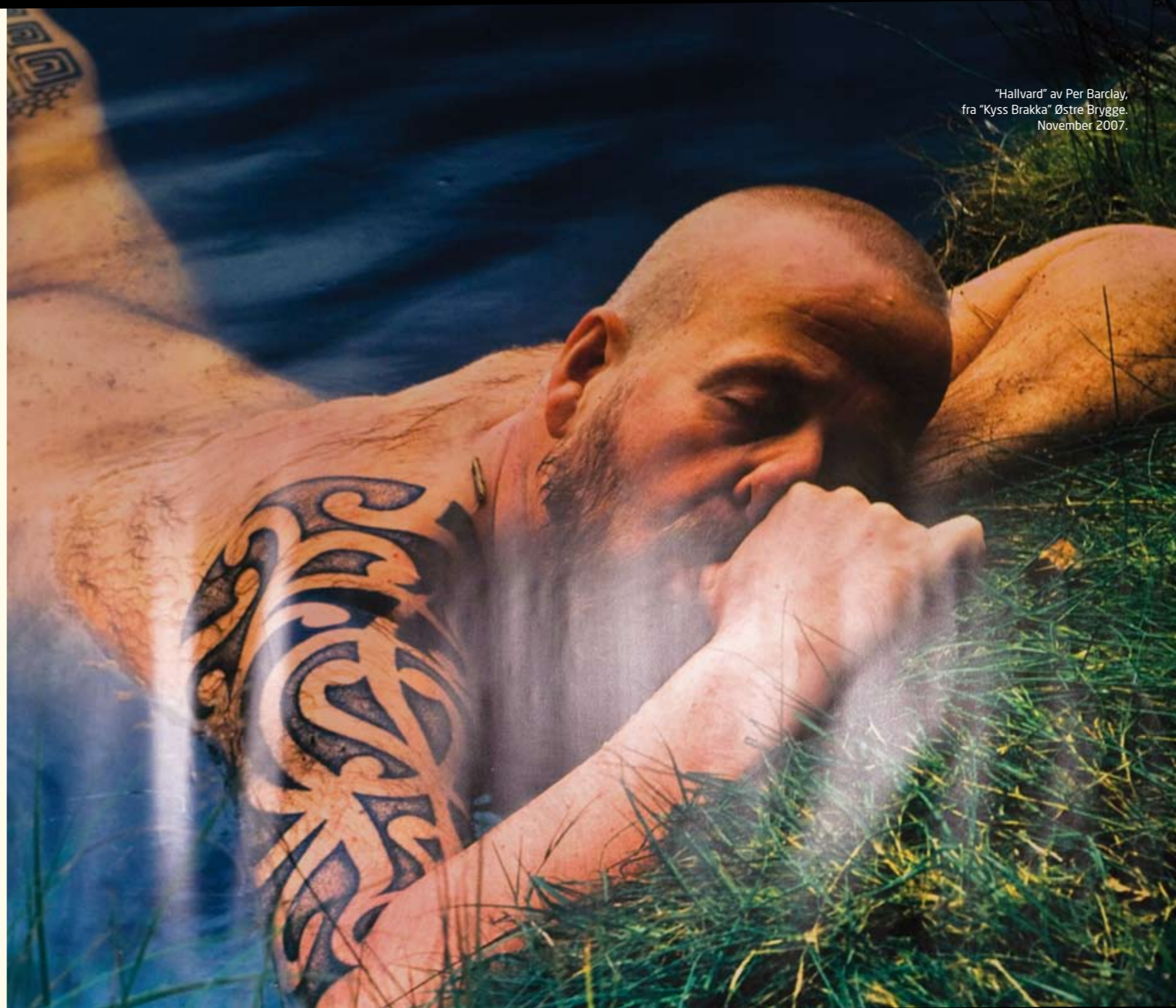
“Hallvard” av Per Barclay, fra “Kys Brakka” Østre Brygge, November 2007.

Porsgrunns kunst og kulturliv har i de seneste årene vært preget av kvalitetsheving på mange plan. På rikspolitisk plan har det tidligere vært en tendens til å skape et politisk motsetningsforhold mellom kvalitet og bredde. Men en fokusering på kvalitet er ikke det samme som å dyrke en elitekultur. Både breddekultur og såkalt amatørkultur er opptatt av kvalitet og gode rammer for sin aktivitet. Vårt arbeid må gjennom denne planens mål og strategier, treffe både bredt og dypt, først og fremst ved en gjennomgående fokusering på kvalitet .