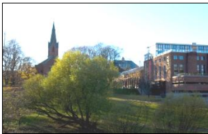
DogA i Oslo, Olavsrose- innehaver nr. 100.

Norsk Kulturarv har gjennomført oppgaver over hele landet: Våre aksjonsmidler har gått til ulike objekt i 395 kommuner. Vi har kanalisert 10 mill. kroner til berging av 2000 bygninger og 2 mill. til rydding av ulike kulturminner, for det meste utført av skoleelever. Bare de to siste "Rydd et kulturminne"-aksjonene reflekterer 85 000 dugnadstimer. Ta kontakt med mathias@kulturarv.no , så gir vi deg oversikt over hvor store midler som har gått til aksjoner i din kommune.