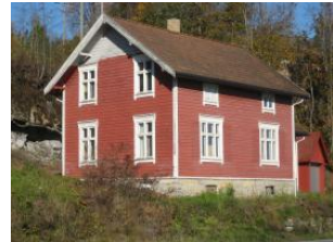
Eksempel på bygninger som har fått midler gjennom ”Ta et tak”-aksjonen:

Øverst til v.: Svalgangshuset Vestgårdstua i Marker