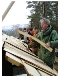
Overføring av håndverkskunnskap ved Senter for bygdekultur: Tekking med spn og stukk-kløyving.

Kommunen er velkommen til å invitere med lokale fagfolk innen forskjellige håndverksmiljø. Dette inkluderer også selvstendige næringsutøvere som er engasjert i aktiv bruk av kulturarven, f.eks. håndverks- og laftebedrifter, skogeiere, eiere av småsagbruk m. fl.